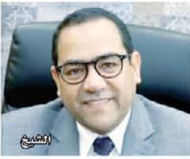
توجيهات بتنقية الجهاز الإداري للدولة من الموظفين العالة والإراهيين

مستشار وخير وتوابعهم في المرحلة الثانية، لخطة الحكومة بتنقية الجهاز الإداري للدولة، والتقصاء على حالة الترهل