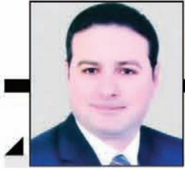
محمد طراييه يكتب