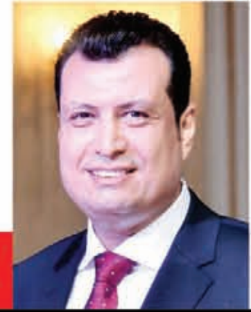
سيد سعيد يكتب:

لا يوجد وزير في الحكومة الحالية، أو الحكومات المتعاقبة، حظى بقدر هائل من السخط الشعبي ضد سياساته، ولا أبالغ على الإطلاق، إن قلت، وضد بقائه أيضاً، مثلما حظى الدكتور طارق شوقي وزير التربية والتعليم، فالرجل منذ توليه منصبه الوزاري، يعيش في كوكب آخر، غير الذي نعيش فيه، هو متفرغ للتطوير عن مجالات التعليم المختلفة، ولا مردوداً الوزير يواجه الانتقادات التي لا تتوقف، بأحدث خبراته غير المحدودة بنظم التعليم في العديد من البلدان، حسبما راج عنه، ويروج هو عن نفسه، وعن قدراته