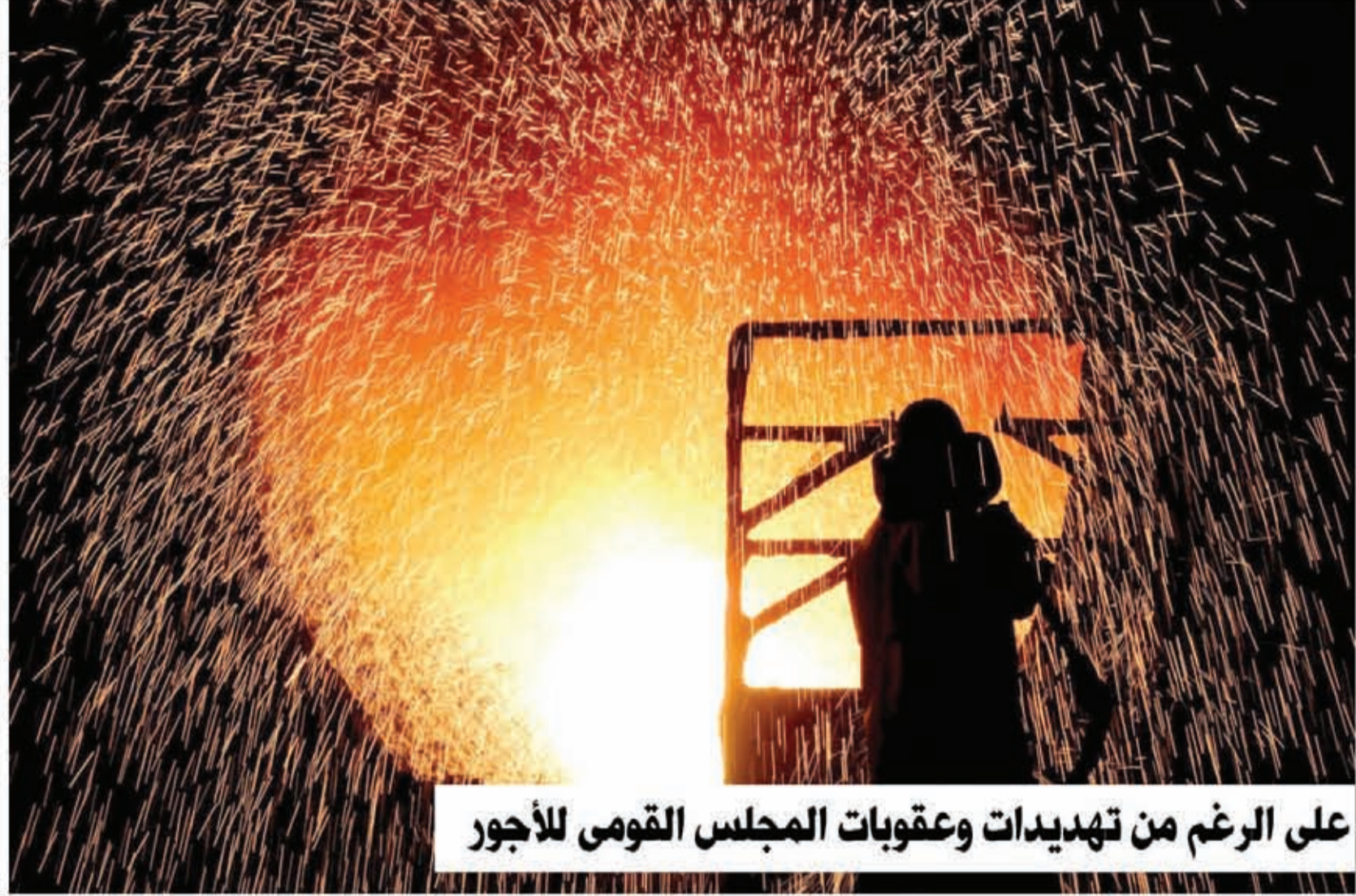
على الرغم من تهديدات وعقوبات المجلس القومي للأجور