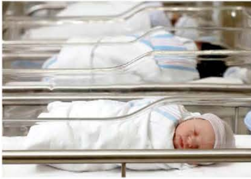
الفاخر لمواليد ٢٠٢١ وما بعدهم سيكون مستقبلا صحيا حضاريا ومتحضرا متكامل الوصول إلى تارجيت خطة التنمية المستدامة ٢٠٣٠.

أكدت المصادر أن منظومة العلاج والرعاية الصحية الفاخرة، ستكون بمثابة هدية الرئيس عبد الفتاح السيسي لهذه الفئات من المواليد وما يليها، مع اكتمال كل عناصر الدولة المصرية الحديثة والجمهورية الجديدة. وبشأن توقعات المصادر لأسعار الاشتراك في المنظومة الصحية الفاخرة، أكدت أنها لن تتجاوز ٢٥٪ من أسعار الرعاية الصحية المناظرة لها في القطاع الخاص أو الاستثماري على الرغم من مضاعفتها لها في الأدوات والأطقم الطبية المعالجة وأماكن العلاج والرعاية. وفي ذات السياق، أكدت المصادر أن الفترة المقبلة ستشهد تطوير لاستفادة أصحاب البطاقة التأمينية، على عكس ما تم ترويجه من شائعات بحذف الأفراد أكثر من هذين على البطاقات التأمينية، مؤكدة أن هذا الكلام ليس دقيقا، أن البطاقات التأمينية سيتم إضافة لها مواليد ٢٠٢١ بضوابط وشروط جديدة يتم دراستها بحيث يصل دعم البطاقات لمستحقيها، وحذف من لا يستحقون من الفئات الميسورة وذات الدخل الشهري العالي.