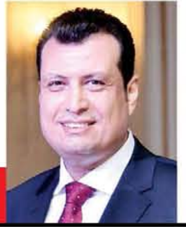
سيد سعيد يكتب:

يمكن لي ولغيري أن نتفهم الحاجة الملحة للإصلاح الاقتصادي بما يحويه من أبعاد طموحة ومتطلبات باتت ضرورية، لكن هذا بكل إيجابياته المتوقعة، يتطلب في ذات الوقت النظر إلى ضرورات أخرى أكثر أهمية.. ضرورات لا يمكن إغفالها أو تجاهلها بأي صورة من الصور، وهي المتعلقة بالوعي الجمعي، ومدى قدرة المواطن على استيعاب الخطوات التي تقوم بها الدولة، فالواقع يؤكد بما لا يدع مجالاً لأي شك، أن أي عملية انتقال أو تحول تحتاج إلى حشد معنوي يهيئ المجتمع للتعايش معها بإيجابية، وهو لم يحدث منذ البدء في عملية الإصلاح،