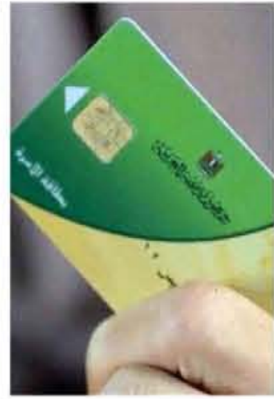
يضمن لهم حياة كريمة ويحافظ على أرواحهم، وفي نفس الوقت بأسعار أقل كثيرا من العلاج خارج المنظومة. موضحة أن خطة التأمين الصحي

كشفت مصادر سيادية رفيعة المستوى، أن عام ٢٠٢٢ سيشهد طفرة غير مسبوقة بالاهتمام بالأطفال مواليد ٢٠٢١ وما بعدها، وأنهم سينالون حظهم أكثر مما قبلهم، لتعلق الدولة الباب على مروجي الشائعات حول فكرة خروج أكثر فئتين من بطاقة التأمين. وأكدت المصادر في تصريحات خاصة لـ «صوت الملايين» أن الرئيس عبد الفتاح السيسي أصدر أوامره لكل المختصين بداية من رئيس مجلس الوزراء، والجهات المعنية، بضرورة توفير رعاية اجتماعية وصحية غير مسبوقه بداية من مواليد ٢٠٢١ وتكوين قاعدة بيانات شاملة عنهم وتسجيلهم لاستخراج بطاقة تأمين صحي فاخرة بأسعار رمزية يتلقاها بموجبها كل أنواع الرعاية الصحية، ودخول المستشفيات الكبرى والفاخرة، وتلقي العلاج اللازم، بأسعار لا تقارن بالأسعار الخارجية. ولفتت المصادر إلى أن الرئيس وجه