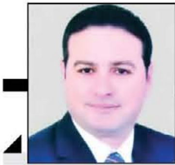
محمد طراييه يكتب:

أما الآن فقد أصبحت الأكاديمية من الجهات التي يتم تداول أسماؤها في نشرات الأخبار والمواقع الإلكترونية وصفحات التواصل الاجتماعي، ومع ذلك لا يزال الكثيرون يعرفون الكثير عنه سواء من ناحية الأهداف التي أنشئت من أجلها والأدوار التي قامت أو ستقوم بها والموازنات المالية المخصصة لها.