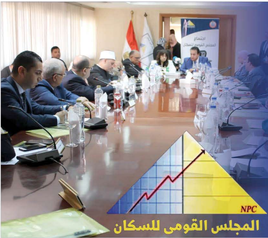
المجلس القومي للسكان

زامن عام ٢٠٢٠ نهاية الخطة التنفيذية الخمسية للاستراتيجية القومية للسكان ٢٠١٥-٢٠٣٠، والتي قام بإعدادها المجلس القومي للسكان وطرحها في نوفمبر ٢٠١٤ تحت رعاية السيد الرئيس عبد الفتاح السيسي، انطلاقاً من الاهتمام الذي توليه القيادة السياسية للقضية السكانية، وما يرتبط بها من قضايا تنموية ذات إبعاد تؤثر في مجملها على جودة حياة المواطن المصري. في هذا السياق تناوالت دراسة مهمة للغاية صدرت مؤخراً بعنوان «متابعة وتقييم: الاستراتيجية القومية للسكان ٢٠١٥-٢٠٣٠»، والتي أعدتها الأمانة العامة بالمركز المصري للفكر والدراسات الاستراتيجية هذه الدراسة كشفت أن الاستراتيجية القومية للسكان رغم تحقيقها نتائج