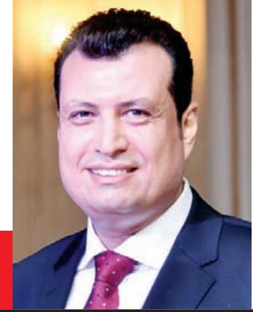
سيد سعيد يكتب:

لم تتوقف الدعوات الرامية للتخريب والفوضى، ولن تتوقف، فالدعوات تتجدد من وقت لآخر، حسب مؤشر ترمومتر علاقات الدولة المصرية بحكومات إقليمية وعالمية، صعوداً وهبوطاً، ففي كل مرة يتكثرون الأسباب وينسجون الروايات المشحونة بالمراعم، وفي كل مرة يلاحقهم الفشل.. ومن فشل لفشل أشد قسوة، لم يدرك دعاة الفوضى وعى المصريين وقدرتهم على فرز الغث من الثمين، حتى أن القوى المحركة لدعاة الإثارة، فشلوا في فك شفرات كتالوج الشخصية المصرية، وموروثها الحضاري والثقافي، فلم تفلح كل محاولات، والغريب أن دعوات التظاهر والنزول إلى الميدان في ١١ - ١١ - ٢٠٢٢، لم تختلف عن الدعوات السابقة، وإن تعددت أسباب التحريض على التخريب.