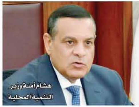
هشام أمرو وزير التنمية المحلية

كما المعتمد المصادر إلى أن حركة المحافظين المقبلة، سيكون من بين المرشحين عدد وافر من القيادات الشبابية الأكفاء الذين خاضوا العديد من ورش العمل والتدريبات في العمل العام والقيادي، سواء من المدنيين أو من بين خبراء المؤسسات العسكرية والقوات المسلحة لضمان السرعة والحزم في مواجهة أي فساد، وسرعة التجاوب مع الشارع وخدمة المواطنين، لما تصبف به شخصيات وقيادات المؤسسات العسكرية التي تصنف وتتميز بالأضباط والحسم والسمعة الجيدة في مواجهة الأزمات، فضلا عن ترشيح الشخصيات أصحاب الخبرات التكنولوجية، المتخصصة في مجالات الإصلاح الإداري والاقتصادي.