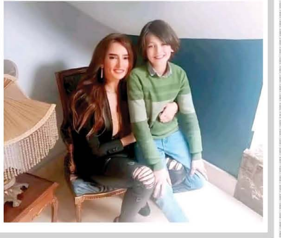
لح عماد شوقي

لده توأم زينة، يشار إلى أنه سبق أن أصدرت محكمة أسرة مدينة نصر حكماً لصالح «توأم زينة» بإلزام أحمد عز بدفع مبلغ قيمته ٤١ ألفاً ٧٠٠ جنيه استرليني، قيمة المصروفات الدراسية لـ «توأم زينة» عن عامين دراسيين، كما قضت بإلزامه بدفع ٤٢ ألفاً و٣٥٠ جنيه مصرياً قيمة مصروفات الانتقال عبر الأتوبيس المدرسي، والزمته بالمصاريف وأتعاب المحاماة. وكانت الفنانة زينة قد أقامت دعوى تطالب فيها بمصروفات دراسية لـ «توأم» من الفنان أحمد عز، حيث قدم معزز الدكر، دفاع زينة، خلال نظر الدعوى في أول درجة، مذكرة تحتوي على أجزء «عز» في فيلمي الممر وأبو عمر المصري والحملات الإعلامية التي يقوم بها. تتظر محكمة استئناف عالي الأسرة الاستئناف المقام من الفنان أحمد عز على حكم أول درجة بإلزامه بدفع ٢١ ألفاً ٥٥٢ جنيه استرليني قيمة المصروفات الدراسية لـ «توأم زينة»، عن العام الدراسي ٢٠٢٠-٢٠٢١، في جلسة ٦ مارس المقبل. قضت بإلزام أحمد عز بدفع ٢١ ألفاً ٥٥٢ جنيه استرليني قيمة المصروفات الدراسية. وكانت محكمة استئناف عالي الأسرة، المنعقدة بالتجمع الخامس، في شهر يونيو الماضي، قد ألزمت الفنان أحمد عز بدفع نفقة شهرية قدرها ٥٠ ألف جنيه