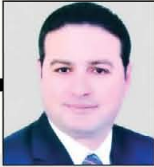
محمد طرابيه يكتب:

إلى ما يشبه الجهة التابعة للحكومة والدليل أننا لم نر استجواباً قوياً حتى الآن يكشف الفساد أو الفشل الإداري داخل الحكومة رغم أن مجلس النواب الحالي مرت على بداية فصله التشريعي الحالي عامين وثلاثة أشهر تقريباً، كما أن عدم إذاعة الجلسات على الهواء أو نشر ما يدور داخل اجتماعات بعض اجتماعات اللجان يؤكد للكثيرين غياب الدور الرقابي لمجلس النواب.