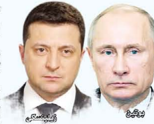
بمجلس أكثر برودة.

كما أن استهلاك الطاقة سيحتاج إلى الخفض بنسبة تتراوح بين ١٥ و ١٠ في المئة مقارنة بالسنوات الأخيرة. ويهدد ارتفاع العائد للأسعار عددا متزايدا من الشركات التي اضطر بعضها لخفض أنشطتها. فالحرب في أوكرانيا، دفعت بمنظمة التجارة العالمية إلى خفض توقعاتها للنمو الخاصة بالنمو الجاري بمقدار النصف تقريبا، من ٤.٧ في المئة إلى ٢.٥ في المئة، بسبب تأثير الحرب والسياسات المتعلقة بذلك، وفقا لما كشفت منظمة التجارة العالمية. ويرتبط تخفيض التوقعات أيضا بمشاكل سلاسل التوريد التي ظهرت نتيجة جائحة كورونا. وقالت منظمة التجارة العالمية إن العوائق سوف تزداد أسعار المواد الغذائية، وعبرت عن قلقها من الأزمة الغذائية القادمة، وأكدت المنظمة أنه بالرغم من أن أوكرانيا وروسيا تشكّلان ما لا يزيد عن ٢.٥ من صادرات التجارة العالمية إلا أنهما في غاية الأهمية في قطاعات معينة. وأضافت «القلق الأساسي يتعلق بشعب أوكرانيا طبعاً، الذين نزحوا من منازلهم ولا يجدون ما يكفي من الطعام. وقالت إن الاقتصاد العالمي سوف يعاني بشدة، وإن الدول الفقيرة هي التي ستعثر بنقص الإمدادات من المواد الغذائية