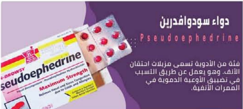
دواء سودوافدرين Pseudoephedrine

مؤكداً على ضرورة أن تقوم الجهات المعنية بحصر جميع المستحضرات الصيدلانية التي تحتوي على المادة... واستخدام مادة «سودوافدرين» فى صناعة المواد المخدرة تهدد صحة المصريين